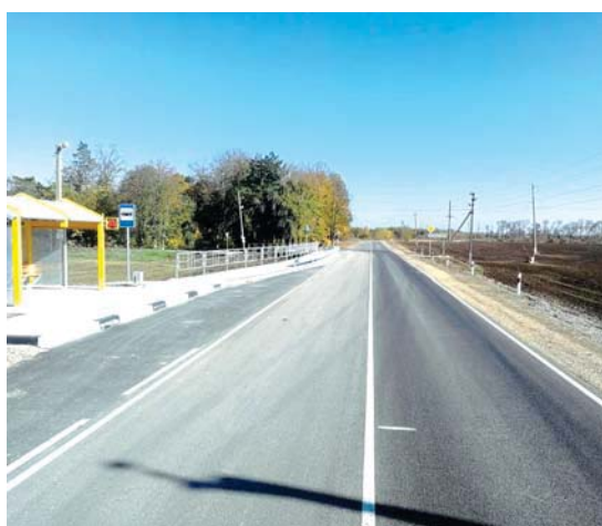
Участок дороги Медведовская — Большевик после ремонта