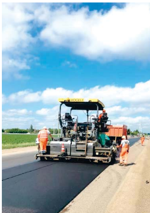
Идут работы на участке Кореновск — Тимашевск

нить их. Следовательно, увеличилась производительность труда.