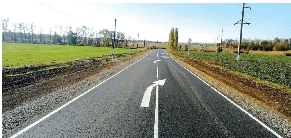
Отремонтированный участок дороги Медведовская — Большевик

Прораб участка по строительству и ремонту автодорог Евгений Сушко сегодня повезет вас