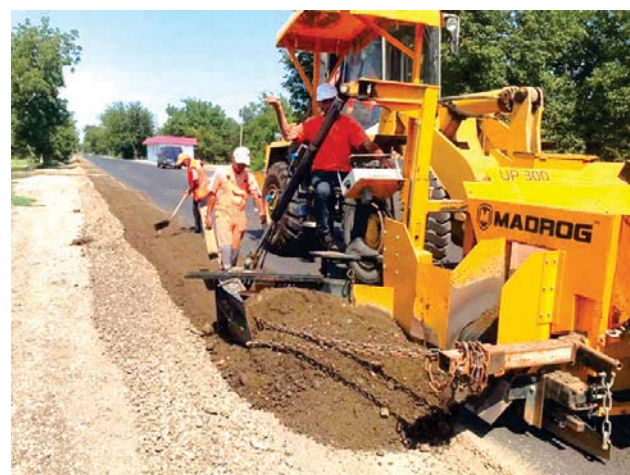
На участке Советский — Красноармейский