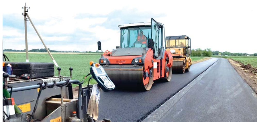
Ведутся работы на участке Советский — Красноармейский