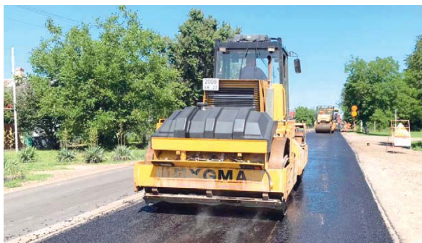
На участке Советский — Красноармейский

СДЕЛАНО: в 2021 году отремонтировано 28,408 км автомобильных дорог. Введено досрочно объектов за счет средств федерального бюджета — 8,595 км автомобильных дорог.