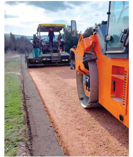
Поселок Сахарная Головка рядом с Севастополем (2022)

на короткое время,— объясняет Михаил Юрьевич. — Сейчас, когда уже трамвайные пути лежат на своем месте, а специалисты занимаются отладкой контактной сети, устанавливаются знаки и оборудуются пешеходные переходы, мало кто из жителей помнит, какие объемы работ тут выполнялись. Мы переносили инженерные сети под автомобильную дорогу, устраивали ливневку и так далее. Именно то, что сейчас под землей и скрыто от глаз, как раз и несло на себе основную нагрузку по работе.