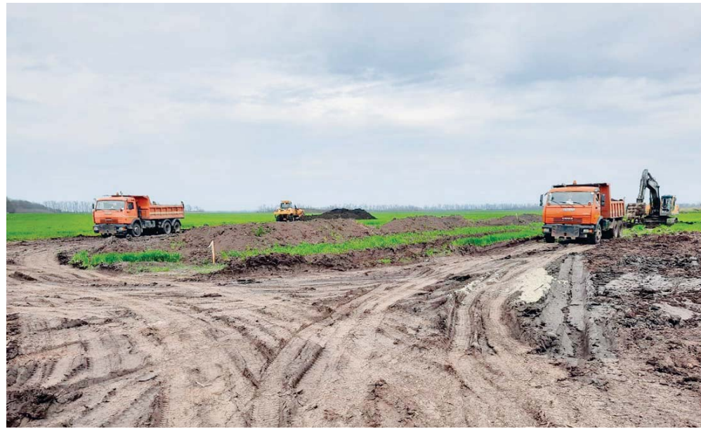
Начало прокладки Дальнего западного обхода вокруг Краснодара