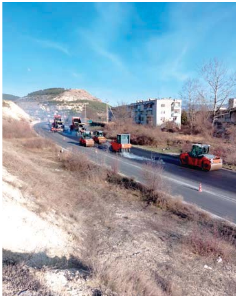
Ремонт дороги Полюшко — Верхнесадовое в Севастополе (2022)