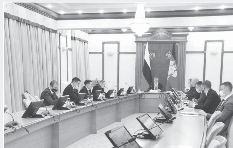
Заместитель главы администрации (губернатора) Краснодарского края Сергей Болдин провел совещание, посвященное обеспечению безопасности людей и территорий в период весенних паводков

Заместитель главы администрации (губернатора) Краснодарского края Сергей Болдин провел совещание, посвященное обеспечению безопасности людей и территорий в период весенних паводков.