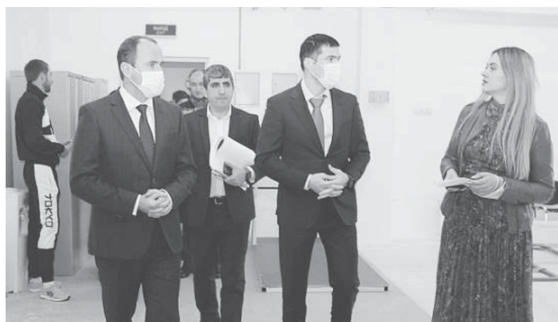
Министр физической культуры и спорта Краснодарского края Серафим Тимченко побывал с рабочей поездкой в Геленджике

Министр спорта осмотрел также отремонтированный в 2020 году Центр олимпийской подготовки