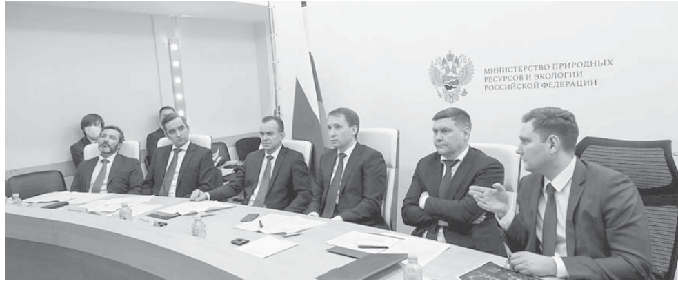
Глава администрации (губернатор) Краснодарского края Вениамин Кондратьев на рабочей встрече по реализации национального проекта «Экология»

Региональной власти в этом году необходимо разработать проектную документацию по расчистке реки Гречаной в Калининском районе, а также провести инвентаризацию