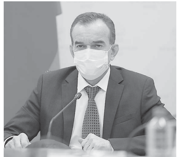
Глава администрации (губернатор) Краснодарского края Вениамин Кондратьев провел личный прием граждан

Шла речь на приеме граждан и о необходимости привести в порядок стадион в Славянском районе, которому уже более тридцати лет. За это время он обветшал, обрушилась крыша. Если раньше игровыми видами спорта занимались порядка пятисот человек, то теперь им негде тренироваться. Здесь проводят первенства края по регби, чемпионат Славянского района по футболу среди любителей