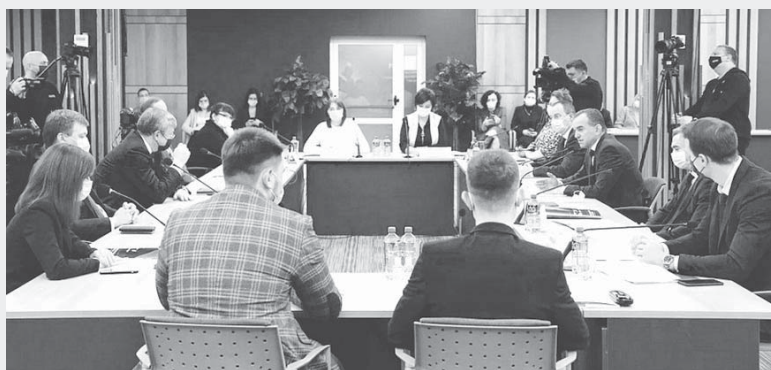
Глава администрации (губернатор) Краснодарского края Вениамин Кондратьев принял участие в круглом столе, посвященном запуску проекта по поддержке инноваций студентов и начинающего бизнеса

Глава администрации (губернатор) Краснодарского края Вениамин Кондратьев принял участие в круглом столе, посвященном запуску проекта по поддержке инноваций студентов и начинающего бизнеса. Программу реализуют в рамках профильного нацпроекта.