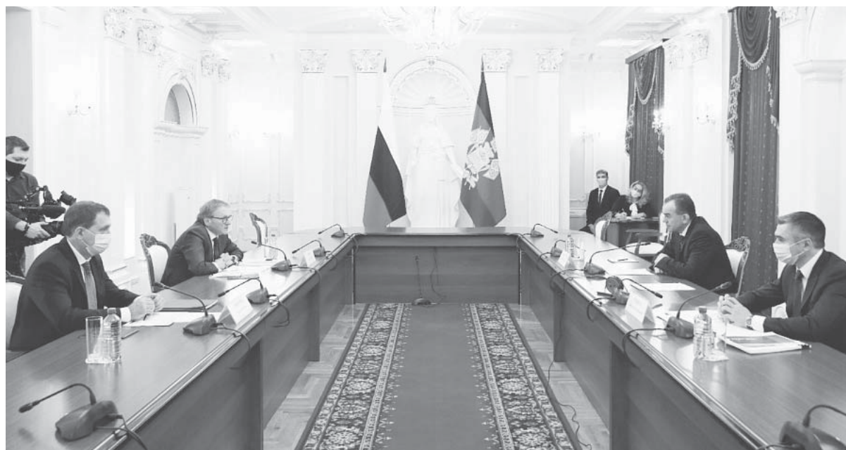
Глава администрации (губернатор) Краснодарского края Вениамин Кондратьев и уполномоченный по защите прав предпринимателей РФ Борис Титов обсудили изменения в законе о туризме

Было озвучено, что проект закрепляет порядок деятельности гостевых домов, вводит их классификации и услуги. На Кубани большие возможности для развития бизнеса, особенно в курортной сфере. Очень важно снять все законодательные препятствия для работы гостевых домов, что и призван сделать разработанный Ростуризмом проект поправок к закону об основах туристской деятельности. Решается вопрос о том, чтобы гостевые дома получили легальный статус и были избавлены от избыточно-го контроля.