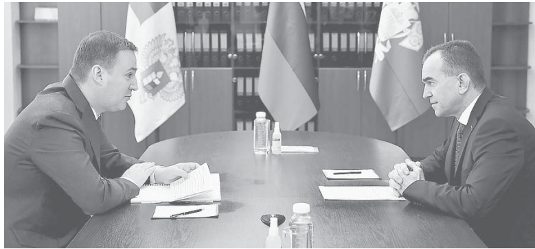
Глава администрации (губернатор) Краснодарского края Вениамин Кондратьев на рабочей встрече с министром сельского хозяйства РФ Дмитрием Патрушевым

Глава администрации (губернатор) Краснодарского края Вениамин Кондратьев на рабочей встрече с министром сельского хозяйства РФ Дмитрием Патрушевым выступил с инициативой пересмотра условий предоставления субсидий аграриям.