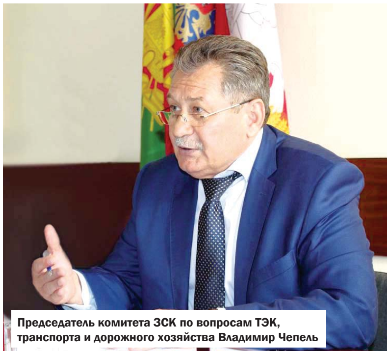
Председатель комитета ЗСК по вопросам ТЭК, транспорта и дорожного хозяйства Владимир Чепель

Иван Петров также обратил внимание на эффективность использования бюджетных средств. В частности, благодаря ранее действующей подпрограмме «Развитие промышленности и повышение ее конкурентоспособности» на улицы Краснодара вышло более двухсот новых автобусов средней и малой вместимости, приобретенных в рамках софинансирования