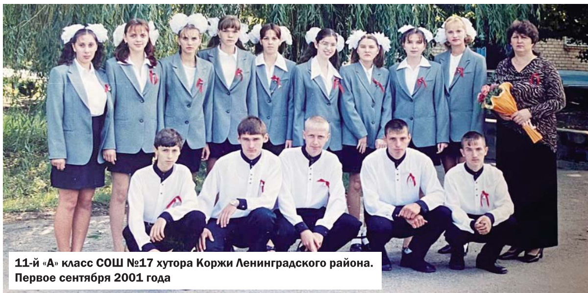
11-й «А» класс СОШ №17 хутора Коржи Ленинградского района. Первое сентября 2001 года