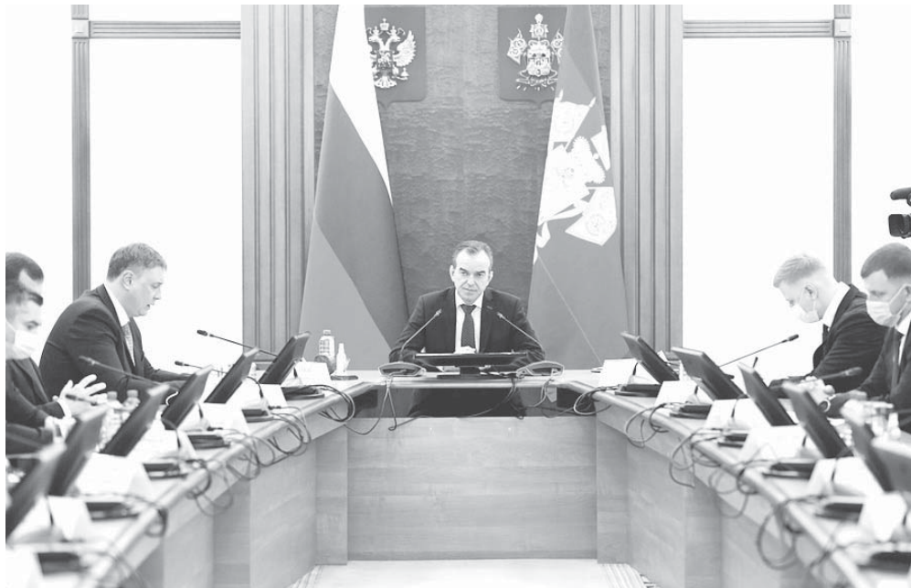
Глава администрации (губернатор) Краснодарского края Вениамин Кондратьев провел расширенное планерное совещание

На совещании шла речь и о строительстве школ и детских садов. В этом году необходимо завершить возведение в крае 17 школ и 8 детских садов.