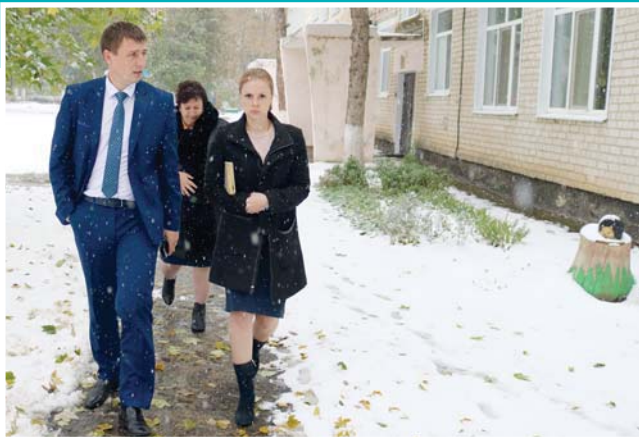
Строительство детских садов под личным контролем главы района. Актуальной очереди в ДДУ района уже нет