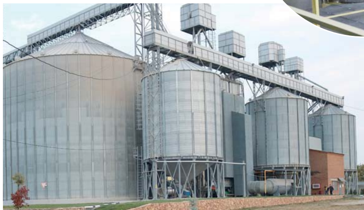
Крахмальный завод «Гулькевичский» выходит на международный уровень

Также выше среднекраевых темпы роста финансовых результатов деятельности предприятий. Достичь этого удалось, в частности, благодаря тому, что продукция наших промышленных предприятий отличается высоким качеством и поставляется на крупные стройки федерального и регионального значения. Так, металлоконструкции ОАО «Северо-Кавказский завод стальных конструкций» использовались при строительстве Ростовской АЭС, Новочеркасской ГРЭС — ПС, здания международного аэропорта в Симферополе. С 2016 года предприятием освоено выпуск дождевальных машин и прицепных агрегатов глубокой вспашки для сельскохозяйственной техники. Кстати, это направление стал развивать наш предприниматель, который специализировался на культивировании орошаемых земель. До позапрошлого года он закупал технику на стороне. Но, посчитав, решил заняться собственным производством. Сейчас он не только полностью покрывает потребности своего бизнеса, но и реализует агрегаты другим предприятиям и фермерам.