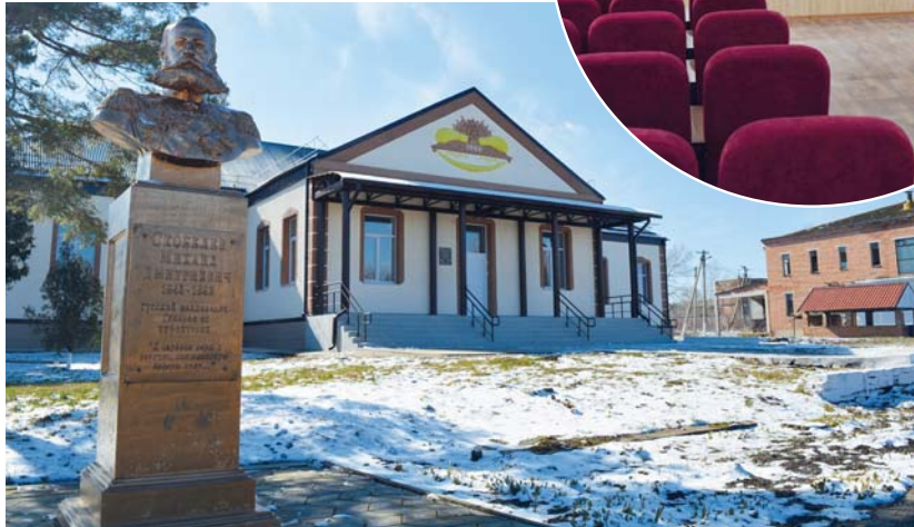
Дом культуры в станице Скобелевской после недавнего капремонта

Каждое утро я распечатываю посты со своих страниц и на обороте листа даю поручение соответствующему специалисту со сроком исполнения. В назначенный срок он обязан отчитаться в том, что сделано, а я проверяю. Лично. Потому что с самого детства был воспитан по принципу: пообещал — исполни во что бы то ни стало. С другой стороны, это порой мешает, так как жду от других такого же отношения, но не всегда эти надежды оправдываются.