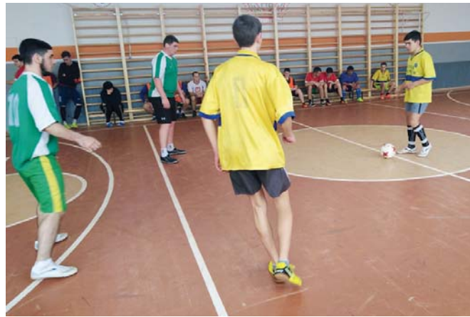
Спортзал на хуторе Тысячном после капремонта стал центром притяжения для детей и взрослых

— Мы работаем по всем направлениям, но спорт — это для нашего района всё. Я призер краевых игр и чемпионатов ЮФО по волейболу, играю в футбол за районную команду и не представляю себе жизни без спорта. По нашим исследованиям, половина населения района в возрасте от трех до 79 лет занимается спор-