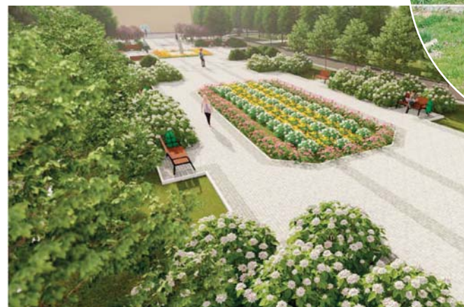
Такой будет Аллея имени дважды Героя Советского Союза летчика-космонавта В. В. Горбатко на его родине в поселке Венцы

Я абсолютно уверен, что жизнь в районах не должна качественно отличаться от условий в мегаполисах. Взять Интернет. На сегодня это необходимость. Кстати, я активно использую социальные сети и мессенджеры для коммуни-