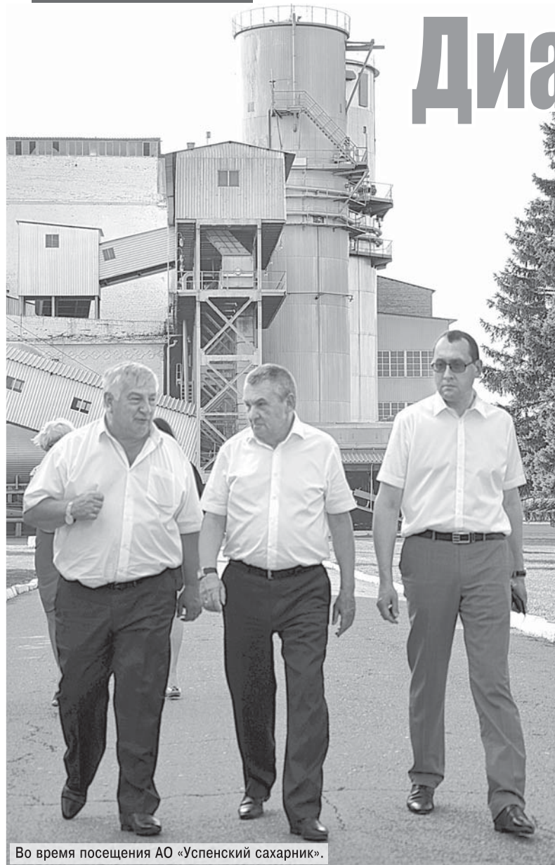
Во время посещения АО «Успенский сахарник».

С 25 августа по 11 сентября 2015 года члены фракции партии «Единая Россия» в Законодательном Собрании Краснодарского края работали в избирательных округах. За этот период они провели 416 встреч в муниципальных образованиях края, в том числе с активом территорий, руководителями территориального общественного самоуправления, ветеранами, коллективами предприятий, работниками образования и здравоохранения, других социальных учреждений. Стоит сказать, что кубанцы проявили повышенный интерес к этим встречам. В них приняли участие 36 860 избирателей.