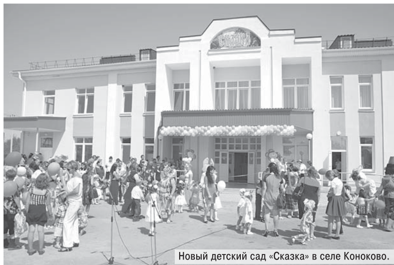
Новый детский сад «Сказка» в селе Коноково.