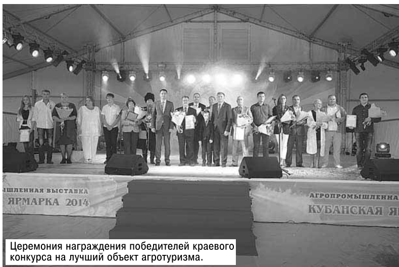
Церемония награждения победителей краевого конкурса на лучший объект агротуризма.

Поселения-победители задают тон в работе по развитию малых форм хозяйствования не только в своих муниципальных образованиях, но и в целом в крае. В личных подсобных хозяйствах здесь выращивается КРС мясной и молочной пород, домашняя птица, а значит, производится мясо, молоко, молочная продукция, яйца. На приусадебных участках получают хорошие урожаи овощей (на открытом и закрытом грунте), плодов и ягод. Такая работа приносит радость, удовлетворение