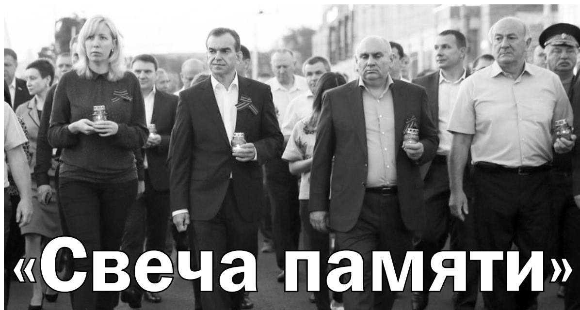
ВО ВСЕРОССИЙСКОЙ АКЦИИ В КРАСНОДАРЕ ПРИНЯЛИ УЧАСТИЕ ОКОЛО ДЕСЯТИ ТЫСЯЧ ЧЕЛОВЕК

На рассвете колонна жителей города прошла от Театральной площади к Вечному огню, где состоялся траурный митинг по погибшим в годы Великой Отечественной войны. Горящие свечи к мемориалу поставили врио губернатора Вениамин Кондратьев, представители ветеранских