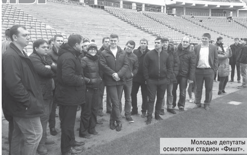
Молодые депутаты осмотрели стадион «Фишт».

Как отметил А.В. Поголов, в крае действует 27 краевых государственных программ, которые были согласованы с кубанским парламентом. На их реализацию в этом году запланировано почти 198 млрд рублей, или около 95 % от всех расходов краевого бюджета. Приоритетным направлением в расходовании средств в рамках госпрограмм остается, как и в прежние годы, финансирование социальной сферы – образования, здравоохранения, культуры, физической культуры и спорта, исполнения всех обязательств по социальной поддержке населения. Однако в последние годы региональный бюджет формируется в