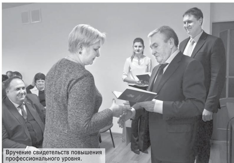
Вручение свидетельств повышения профессионального уровня.

На базе Краснодарского регионального института агробизнеса прошел семинар для заместителей глав городских округов и муниципальных районов Краснодарского края, курирующих финансово-экономическое направление. Его тема созвучна с тем, о чем шла речь в ходе цикла научно-практических конференций – «Укрепление финансово-экономических основ муниципальных образований Краснодарского края». Необходимость семинара стала очевидна в ходе проведения этих конференций.