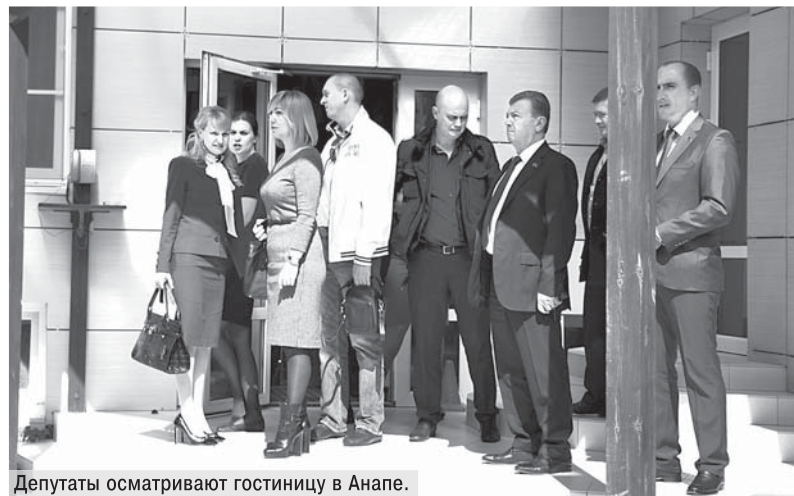
Депутаты осматривают гостиницу в Анапе.

известно, наш край является принимающей территорией. Уполномоченный орган – министерство по курортам, туризму и олимпийскому наследию. Процедурой непосредственно занимаются аккредитованные им структуры. На сегодняшний день это пять организаций: НАО «Курорт экспертиза», АНО «Учебно-консультационный центр «Курортконсалтинг», ООО «Центр сертификации, классификации и контроля качества», ООО «Стандарты и Сервис», ООО «Центр Архитектурно-строительного Надзора».