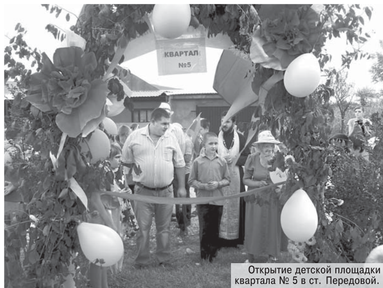
Открытие детской площадки квартала № 5 в ст. Передовой.