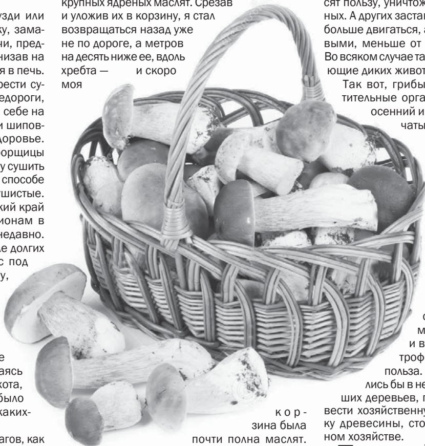
корзина была почти полна маслят.

Я огляделся. Вокруг меня было десятка два крупных ядреных маслят. Срезав и уложив их в корзину, я стал возвращаться назад уже не по дороге, а метров на десять ниже ее, вдоль хребта — и скоро моя