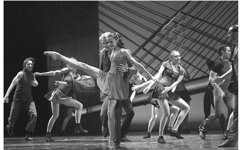
графические коллективы. В этот раз кубанцы насладились творчеством Санкт-Петербургского государствен-

Юбилейный фестиваль не обошелся без новшества. Так, одним из его важных событий стал круглый стол, на котором обсуждались вопросы развития жанра современной хореографии на Кубани.