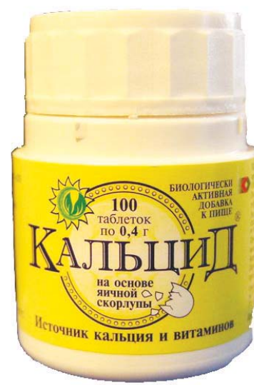
БАД. Не является лекарственным средством.