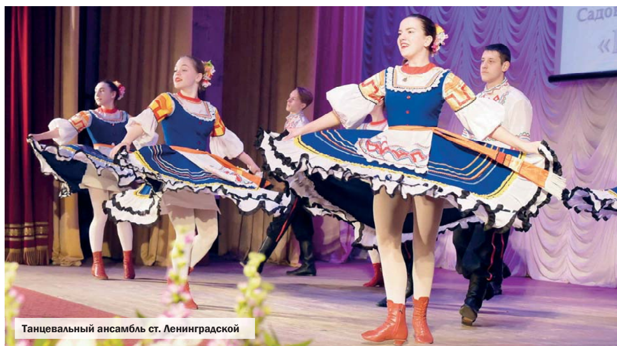
Танцевальный ансамбль ст. Ленинградской