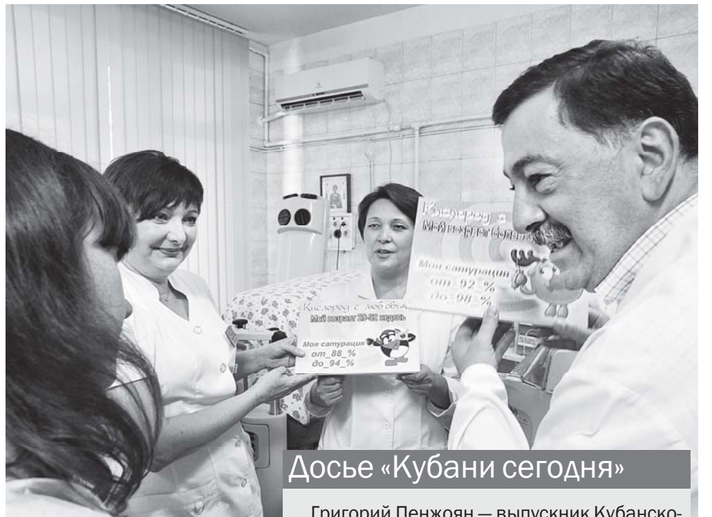
Досье «Кубани сегодня»

— По-разному. Относительно недавно был хирургический пациент издалека и с простым вмешательством: когда спросили его, почему понадобилось ехать за несколько тысяч километров ради плановой операции, он рассказал, что в Интернете нашел, что ККБ №2 — первая в стране по их количеству. Если взять пластическую хирургию, то прилив пациентов связан с тем, что в той же Москве цены на нее кусаются о-го-го как. Из-за рубежа к нам приезжают бывшие соотечественники, привозят друзей-знакомых: даже если они не сохранили гражданство для бесплатного лечения по полису обязательного медицинского страхования, цены на медпомощь, особенно высокотехнологичную, несопоставимы. Хотя даже относительно простая операция — такая, как холецистэктомия, удаление желчного пузыря, в Европе стоит пятнадцать тысяч евро, у нас — 30 тысяч рублей, а если у вас есть полис ОМС и направление из поликлиники, то и бесплатно.