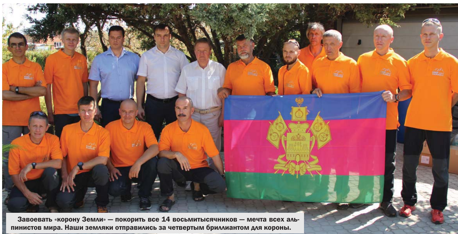
Завоевать «корону Земли» — покорить все 14 восьмитысячников — мечта всех альпинистов мира. Наши земляки отправились за четвертым бриллиантом для короны.