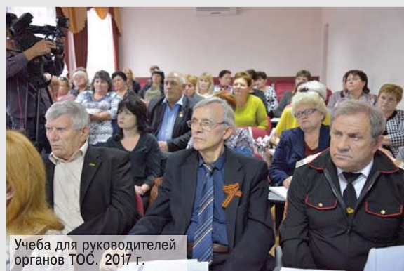
Учеба для руководителей органов ТОС, 2017 г.

По инициативе ЗСК в крае регулярно проходит учеба для представителей муниципального сообщества. В ее рамках уже состоялось 202 семинара. Обучение прошли 10500 человек.