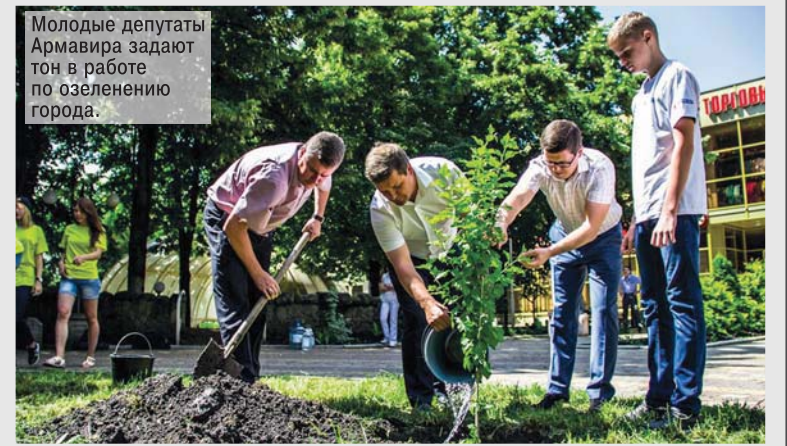
Молодые депутаты Армавира задают тон в работе по озеленению города.

правленные на патриотическое и духовно-нравственное воспитание молодежи, пропаганду спорта и бережного отношения к окружающей среде. Эффективность работы Совета зарекомендовала себя на федеральном уровне – в ряде других регионов создаются или уже созданы аналогичные структуры. Школа молодежного парламентаризма помогла активизировать на местах работу членов СМД, повысить их инициативность. Так, именно молодые депутаты выступили с предложением ввести в краевое законодательство понятие «опорный фермер», что было необходимо для улучшения качества господдержки кубанских сельхозтоваропроизводителей.