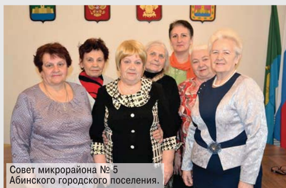
Совет микрорайона № 5 Абинского городского поселения.