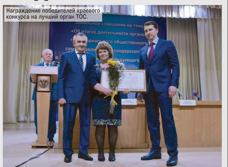
Награждение победителей краевого конкурса на лучший орган ТОС.

Победителям выделяются средства из краевого бюджета на развитие местной инфраструктуры, а руководитель ТОС поощряется денежной премией. Этот конкурс позволил активизировать работу на местах, возродить дух состязательности в работе местных активистов. В итоге ТОСы Кубани стали реальной силой, которая пользуется авторитетом у жителей, на которую в своей работе опираются органы краевой и муниципальной власти. Сейчас в крае действуют около 6 тысяч органов ТОС, это примерно третья часть от всех зарегистрированных в Российской Федерации.