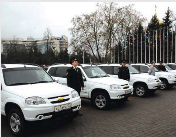
Ежегодно на поощрение победителей краевого конкурса «Призвание» на звание лучшего участкового уполномоченного полиции из бюджета края выделяется 3,5 млн рублей.