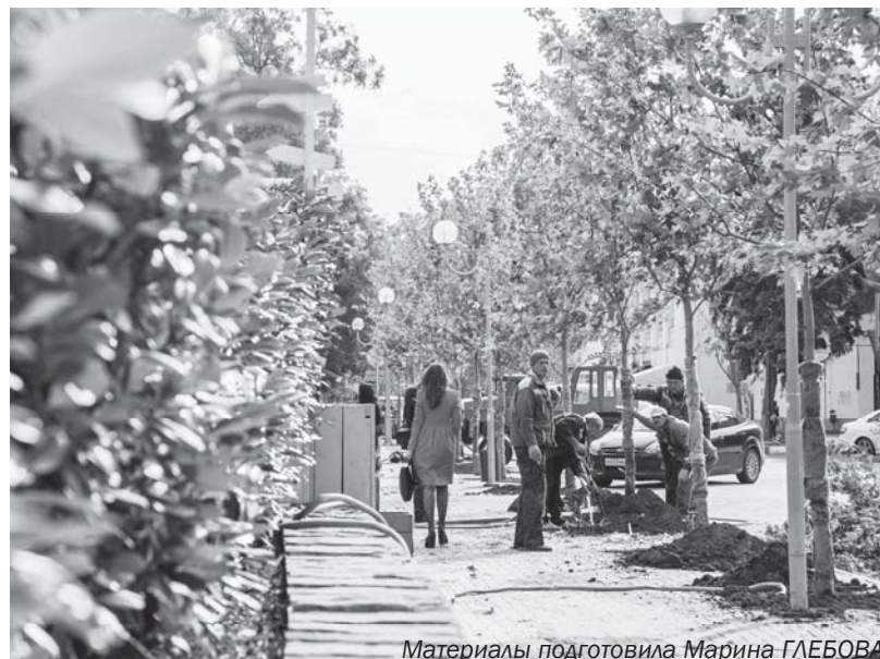
Материалы подготовила Марина ГЛЕБОВА