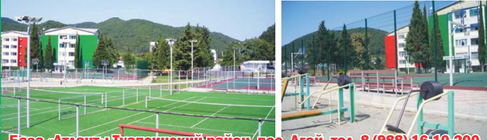
База «Атлант»: Туапсинский район, пос. Агой, тел. 8 (988) 16-10-200

Приглашаем группы спортсменов и школьников для активного отдыха на осенних каникулах