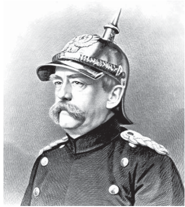
Отто фон Бисмарк

Знаменитое шекспировское «быть или не быть» преследует не одно поколение людей и будет преследовать столько, сколько отпущено жить человеческой цивилизации. Не каждый способен пережить такой успех драматурга, поэтому на протяжении длительного времени Шекспира пытаются уличить в том, что якобы не он написал свои бессмертные сонеты и трагедии, игнорируя при этом самые элементарные и неотразимые факты из биографии драматурга. Хотя бы вот эти. Шекспир вместе с другим драматургом написал ряд пьес, и они шли в театре, где служил ведущим актером Шекспир. Своего сына, рожденного задолго до написания трагедии «Гамлет», Шекспир назвал Гамлетом. Случайность? Совпадение? Мистика? Полноте. Просто судьба пишет страницы жизни людей, которые не всегда легко постичь или предвидеть. Так, Алексею Толстому цыганка нагадала, что