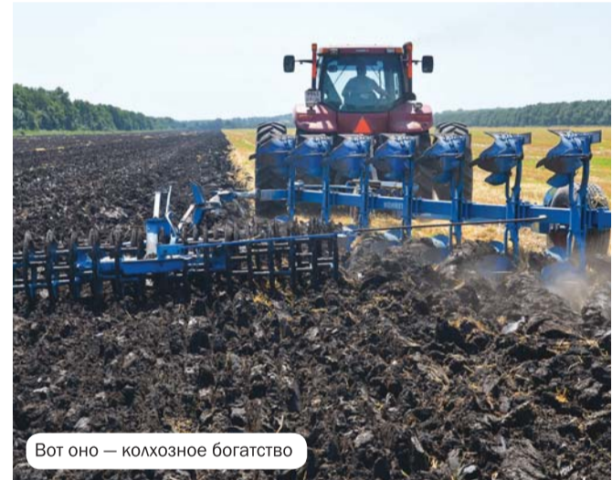
Вот оно — колхозное богатство