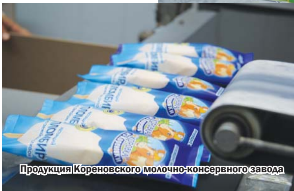
Продукция Кореновского молочно-консервного завода