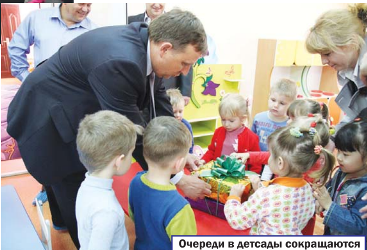
Очереди в детсады сокращаются

— Что, правда тысячу дней?! Надо же, не поленились посчитать. Насчет моего рейтинга, заметьте, это вы сказали... Что же касается внутренних ощущений, могу сказать одно: хорошим горжусь — о плохом сожалею. Ведь репутация района — это и моя репутация, и репутация всей команды, и каждого кореновца. Хорошую репутацию надо создавать каждый день, каждый час, не покладая рук. Только тогда каждый наш земляк, обратит внимание — каждый, будет иметь всё, что называется достойной жизнью. Мы пока далеки от этого, делаем первые шаги, но дорогу осилит идущий. Еще хочется повысить градус отношения к местной власти и настроений. Важно помнить о том, что кризис — это не застой, не пережидание, а развитие. Парадокс? А кто сказал, что будет легко? Наш президент Владимир Путин сказал: не ждите указаний сверху — проявляйте инициативу. И хотя это было обращено к главам регионов, это относится и к муниципальной власти. Не помню кто, но очень правильно сказал: чиновник найдет тысячу причин, почему это нельзя сделать, а государственный человек — почему это надо сделать. Речь о позиции, понимаете?