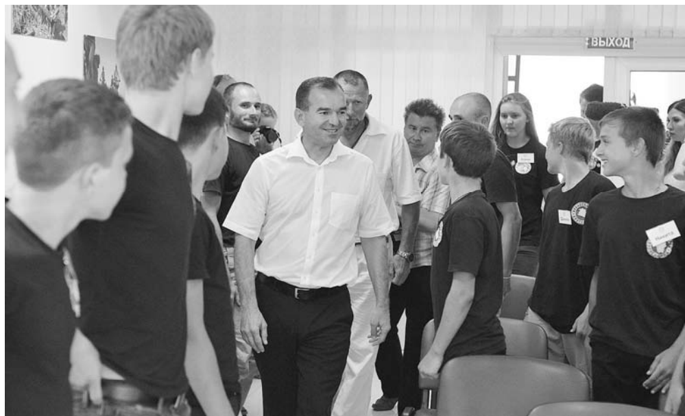
ТАКАЯ «КРУГОСВЕТКА» В РОССИИ ЕДИНСТВЕННАЯ