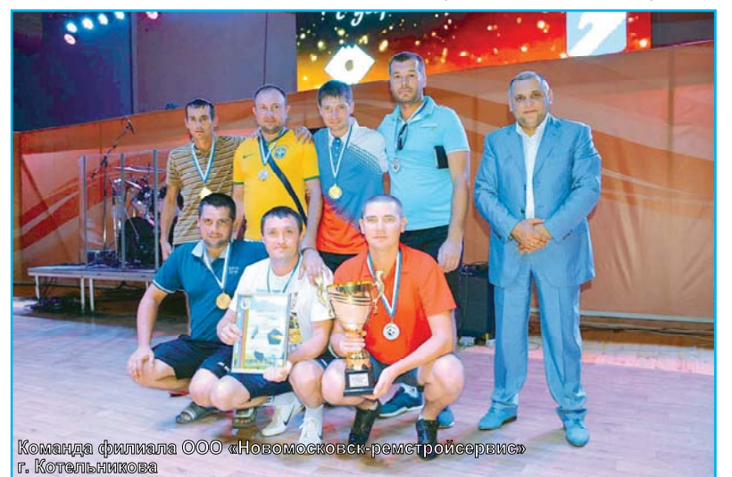
Команда филиала ООО «Новомосковск-ремстройсервис» г. Котельникова

Но на примере ООО «ЕвроХим — Белореченские минудобрения» видно, что компания «ЕвроХим» — это еще и социально ориентированное предприятие, добросовестный работодатель, ответственный налого-