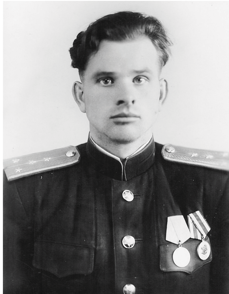
Фото из семейного архива