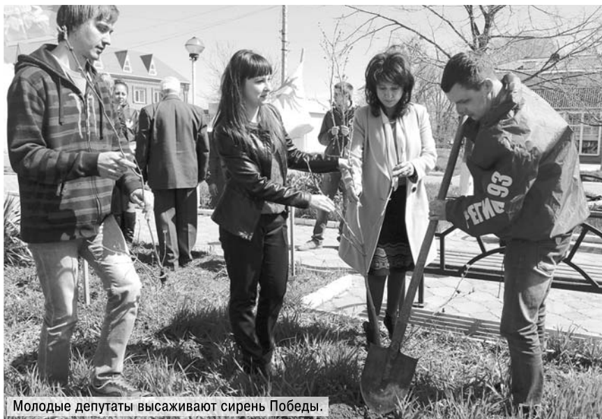
Молодые депутаты высаживают сирень Победы.

школе №3 поселка Мичуринского, ФАПУ, местному детскому саду.