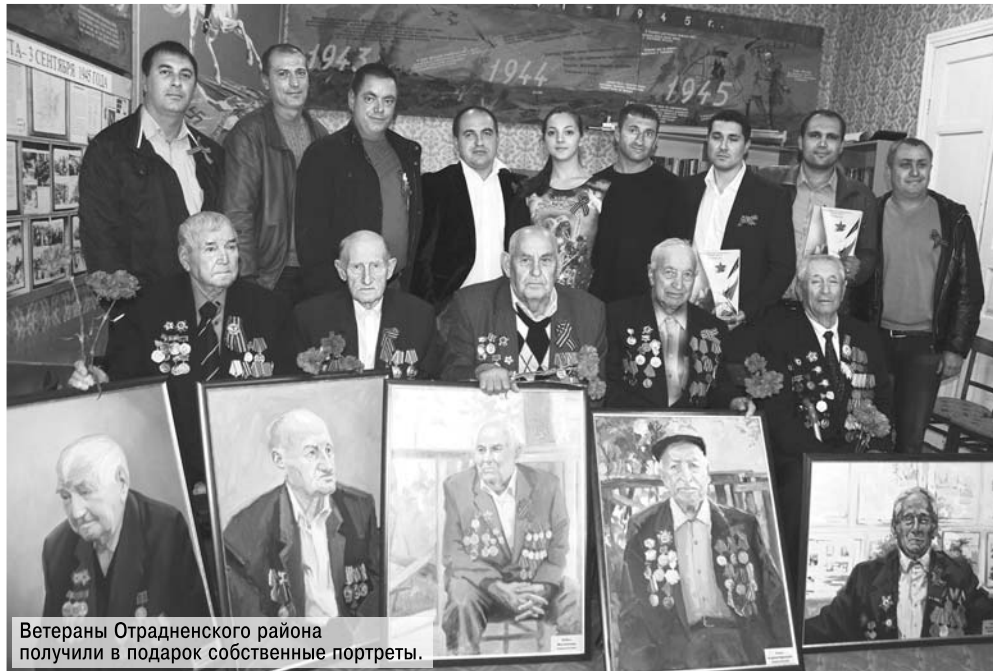
Ветераны Отрадненского района получили в подарок собственные портреты.

Особое внимание молодые депутаты Успенского района уделили подготовке ко Дню Победы. В преддверии праздника они приняли участие в акциях «Сирень Победы» и «Зеленая волна», вручили юбилейные медали ветеранам, провели для школьников «Маршрут памяти» по местам боевой славы, оказали адресную помощь фронтовикам, вместе с молодежными активистами привели в порядок мемориал в Коноковском сельском поселении.