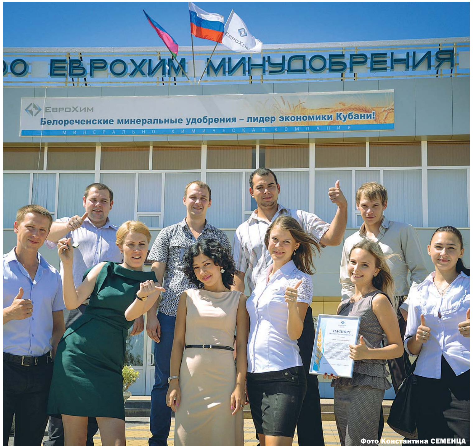
Фото Константина СЕМЕНЦА

Пресс-служба администрации Краснодарского края