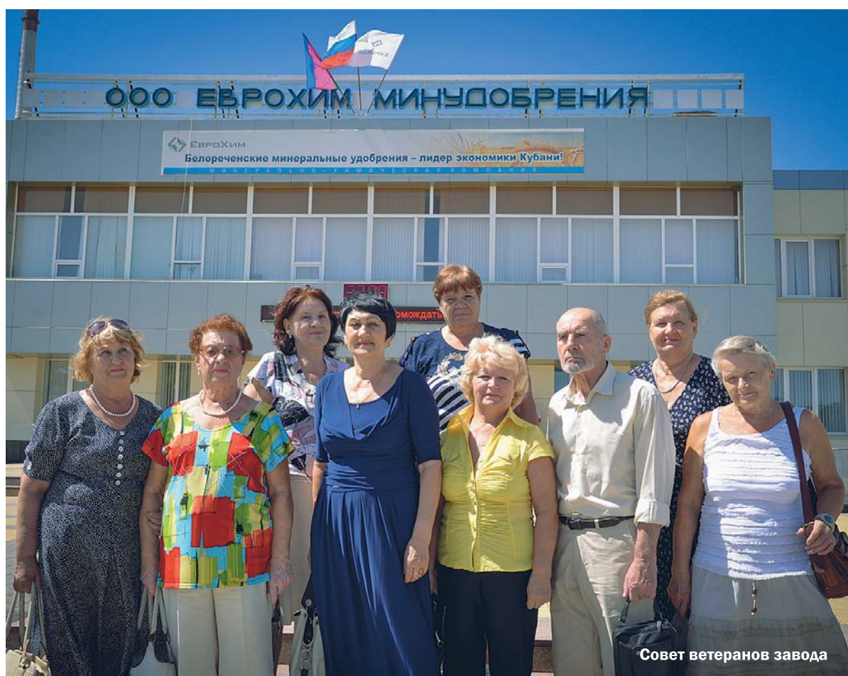
Совет ветеранов завода