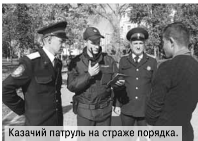
Казачий патруль на страже порядка.

С 1 сентября 2012 года улицы кубанских городов и станиц вместе с сотрудниками полиции патрулируют казаки. Несколько регионов страны последовали примеру Краснодарского края и у себя ввели подобные казачьи дружины. А ближайшие соседи даже приезжали в гости, чтобы все увидеть своими глазами. В феврале 2013 года Законодательное Собрание Краснодарского края с рабочим визитом посетила делега-