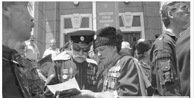
В первом созыве острые политические дискуссии были не только в Законодательном Собрании, но и на площади перед зданием парламента.

Первое пленарное заседание Законодательного Собрания Краснодарского края открылось 14 декабря 1994 года. Законодательное Собрание второго, третьего, четвертого и пятого созывов сформировалось в 1998, 2002, 2007 и 2012 годах соответственно.