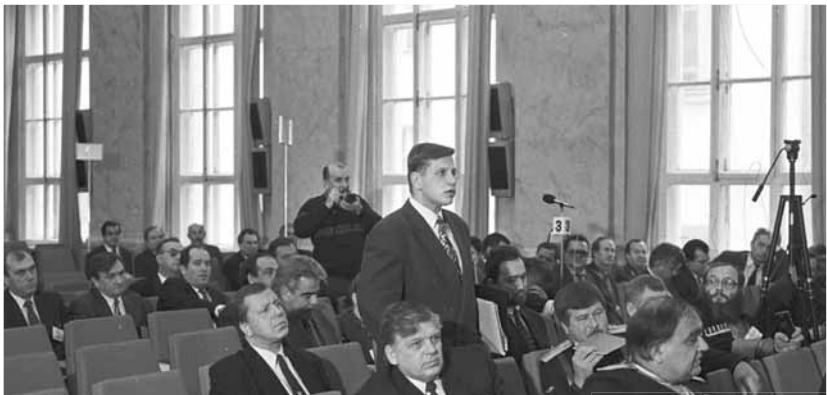
Обсуждение вопроса на заседании в Законодательном Собрании первого созыва.

Первое пленарное заседание Законодательного Собрания Краснодарского края открылось 14 декабря 1994 года. Законодательное Собрание второго, третьего, четвертого и пятого созывов сформировалось в 1998, 2002, 2007 и 2012 годах соответственно.