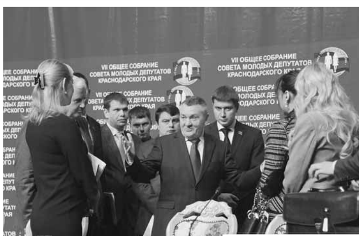
После общего собрания Совета молодых депутатов Краснодарского края, 2013 год.

Законодательное Собрание первого и второго созывов работало в течение четырех лет, третьего и последующих – пять лет. Численный состав ЗСК первого и второго созывов – по пятьдесят депутатов, третьего и четвертого – по семьдесят депутатов, пятого созыва – сто депутатов.