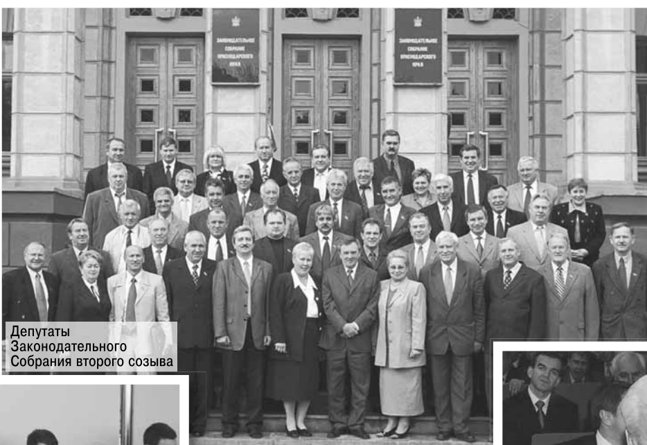
Депутаты Законодательного Собрания второго созыва