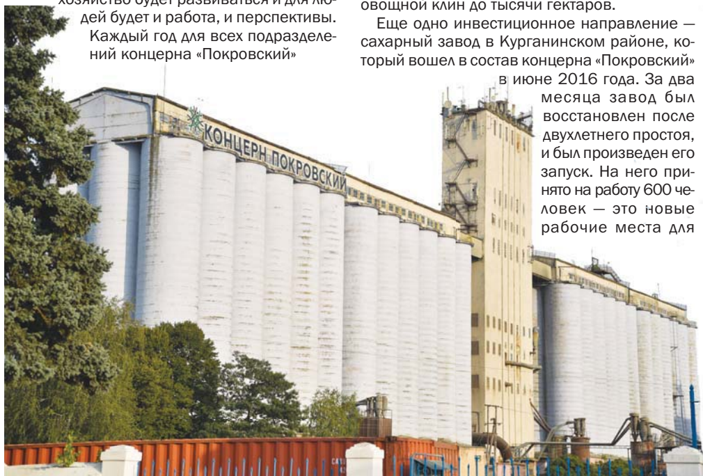
Элеватор на 100 тысяч тонн длительного хранения

Особым образом Лабинская группа концерна «Покровский» выстраивает отношения с пайщиками. В лице местных фермеров есть конкуренция за земли пайщиков, и многие фермеры в этом деле не гнушаются методами: пытаются очернить концерн «Покровский», донести недостоверную информацию, запугать — словом, любым способом оттянуть земли пайщиков. Руководство Лабинской группы в такие дискуссии не вступает. Стараются завоевать пайщиков не за счет домыслов и слухов, а за