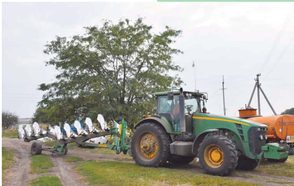
Значительные средства вкладывает хозяйство в техническое перевооружение

А благоприятный он еще и потому, что здесь на погоду надеются, а сами не плошают. Сою подкормили азотными удобрениями, хотя агротехника этого не предписывает — считается, что соя получает достаточное количество азота из воздуха. В период нашего пребывания в хозяйстве уборка сои еще не завершилась, но предварительные результаты уже радуют: если в прошлом году это было порядка 17 центнеров с гектара, то в этом будет не ниже 25 центнеров, а может, и выше — ито-