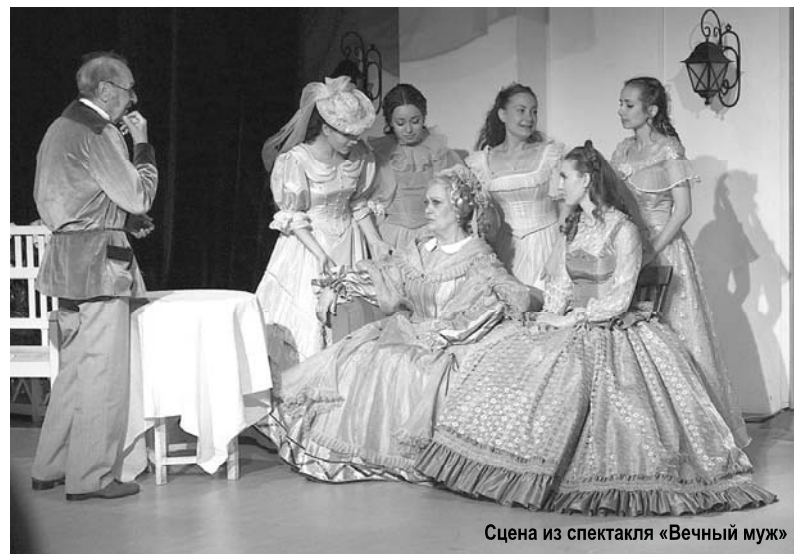
Сцена из спектакля «Вечный муж»

Марина ВЛАДИМИРОВА