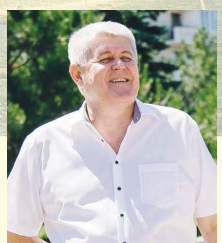
Сергей СЕРГЕЕВ, глава Анапы:

— Оценку высокому сезону в Анапе, конечно, дадут наши отдыхающие. Я лишь скажу, что люди, которые готовились встречать гостей, сделали практически невозможное! Приведу в пример такую цифру: только предприятия санаторно-курортного комплекса, готовясь к сезону, вложили в свое развитие порядка четырех миллиардов рублей! И сегодня здравницы Анапы заполнены практически на 100 процентов, при этом многие перешли на систему «всё включено». Да, мы не заменим полностью турецкие или египетские курорты, да нам и не надо повторяться! У нас своя, самобытная культура и атмосфера! Желаю всем нашим гостям больше солнечных дней, здоровья, хороших впечатлений об отдыхе. И возвращайтесь к нам — мы всегда вам рады!