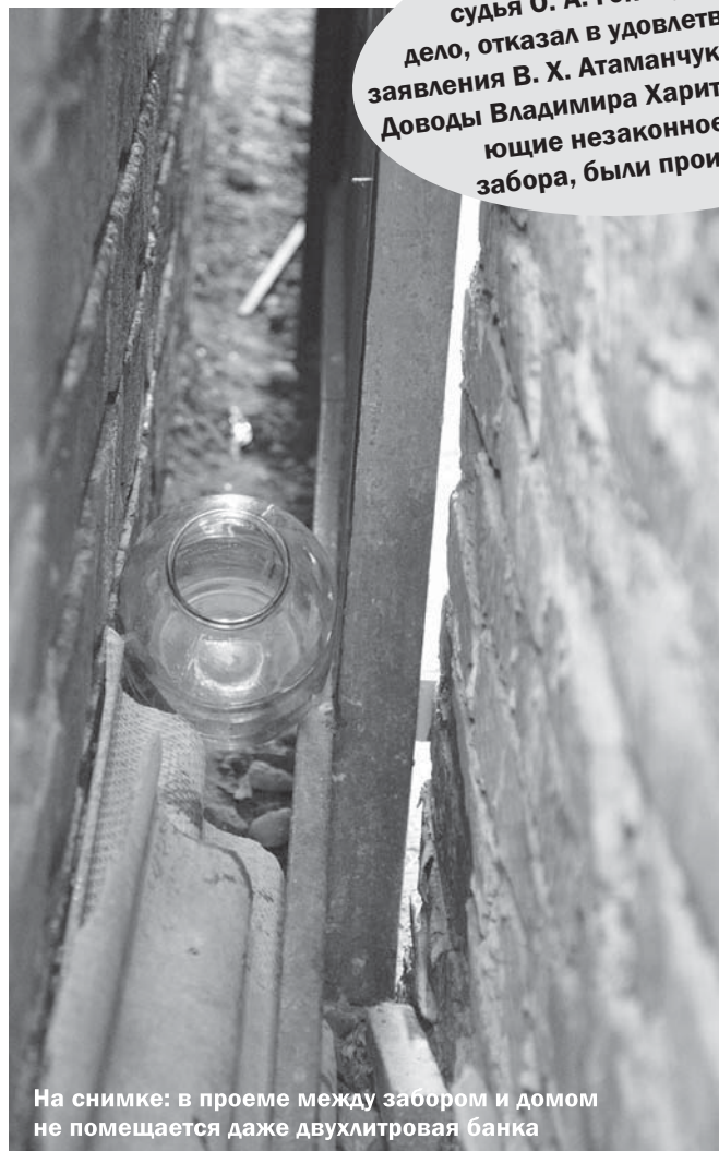
На снимке: в проеме между забором и домом не помещается даже двухлитровая банка