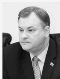
Виктор ТИМОФЕЕВ, первый заместитель председателя городской Думы Краснодара:

— На июньской сессии депутаты приняли решение выйти в ЗСК с законодательной инициативой о внесении поправок в Градостроительный кодекс Краснодарского края. Суть вопроса заключается в том, что с 1 марта 2015 года вступили в силу изменения в Земельный кодекс РФ, касающиеся строительства и размещения объектов инженерной (коммунальной) инфраструктуры на землях, находящихся в государственной или муниципальной собственности. К таким объектам относятся, например, линии и сети газо-, водо-, электро- и теплоснабжения, связи, трансформаторные подстанции, насосные станции.