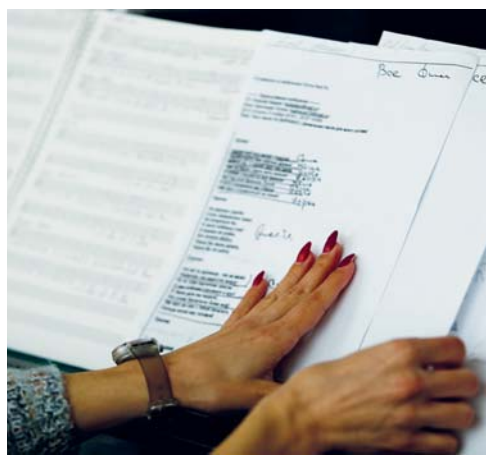
Партитуры, которые зазвучат в «Летят утки...»