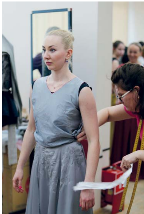
Первые примерки костюмов

теме свадьбы. Задача художника-постановщика — поместить героев нашей истории в такие декорации и так одеть, чтобы в тех же костюмах читалась свадебная тема и одновременно они бы раскрывали те эмоции, те причуды сердца, что как на нитку нанизаны в сюжете спектакля. Ведь свадьба, она какая? Пышная, национальная? Нет, эмоциональная. Свадьба — это сильные чувства, это квинтэссенция самой человеческой природы, когда «люди встречаются, люди влюбляются, женятся».