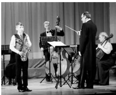
Торжественное открытие летних «Времен года» состоялось в Краснодарском филармонии имени Г. Ф. Пономаренко. Вместе с Московским камерным оркестром «Времена года»

на сцену вышли юные кубанские музыканты.