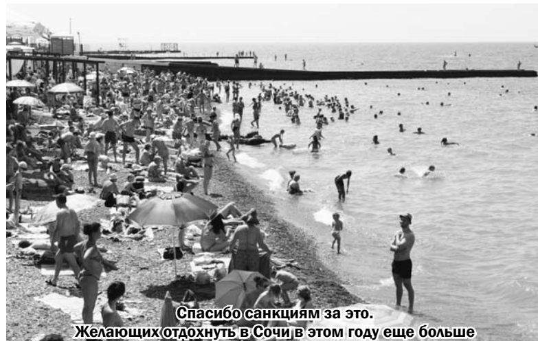
Спасибо санкциям за это. Желающих отдохнуть в Сочи в этом году еще больше

«Попрошайкой» может быть таксист на вокзале, тянущий тебя за рукав в свой «кабриолет», чтобы «нэдорого, очинь нэдорого» отвезти куда-нибудь. Или же «бабушка-риэлтор», предлагающая «элитный