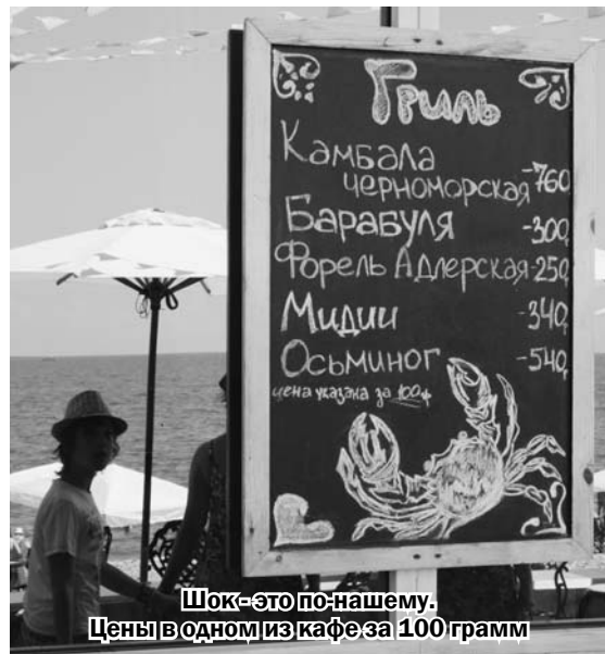
Шок-это по-нашему. Цены в одном из кафе за 100 грамм