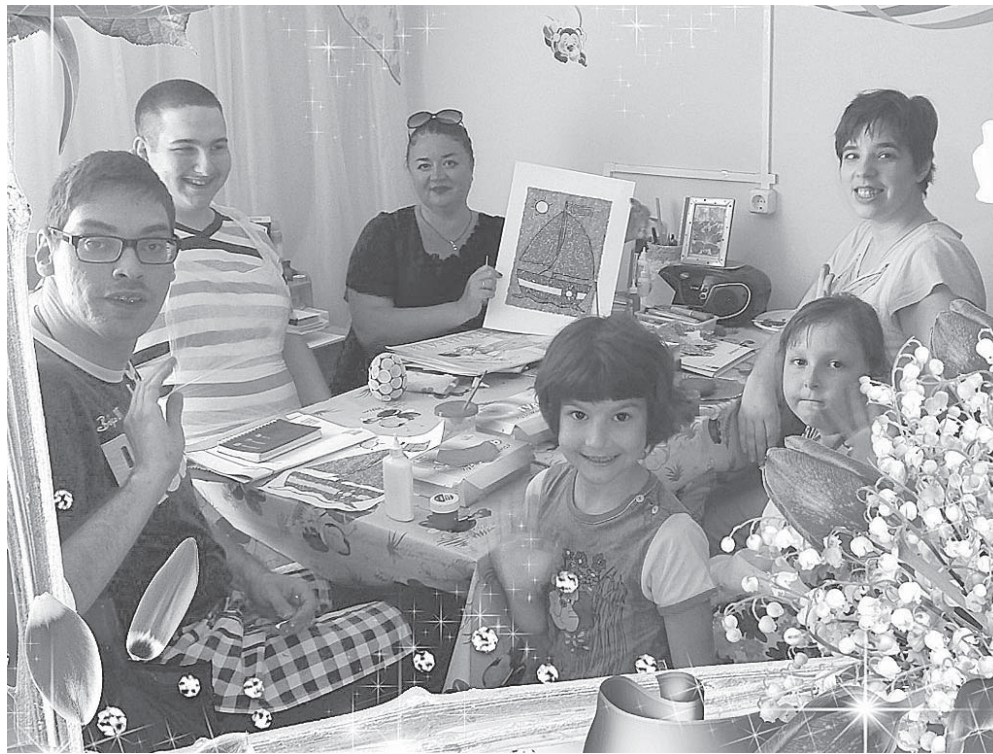
В СТУДИИ КАК ДОМА