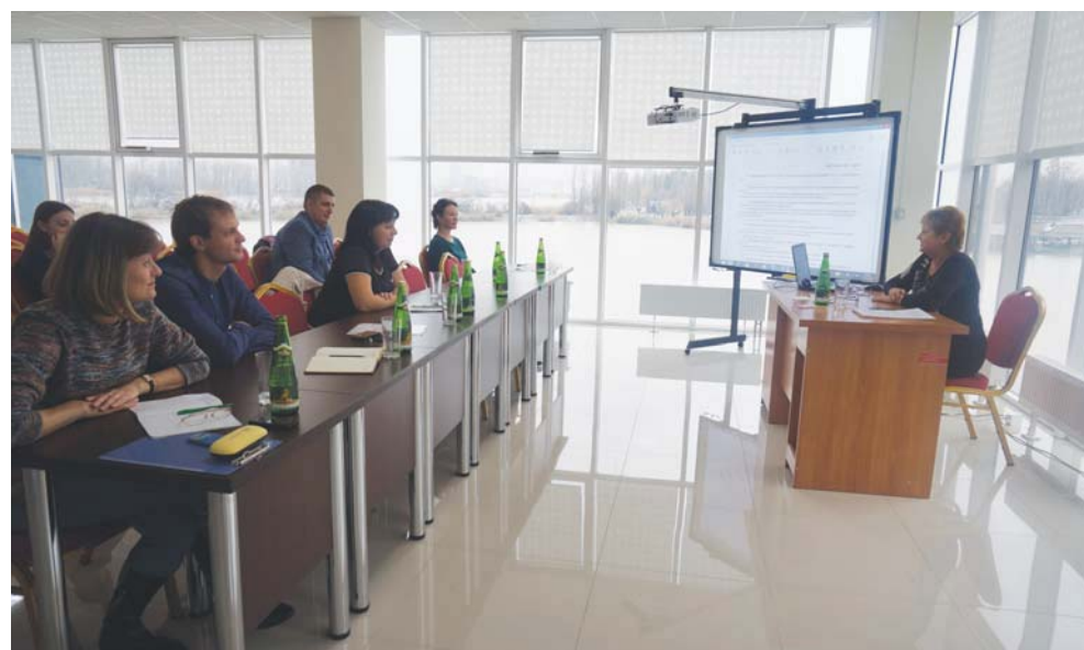
Материалы подготовила Светлана ГАЛАГАН

Подкрепление должно быть незамедлительным, что выражается в справедливой реакции на действия сотрудников. Они начинают осознавать, что их неординарные достижения не только замечаются, но и осязательно вознаграждаются. Выполненную работу и неожиданное вознаграждение не должен разделять слишком большой промежуток времени: чем больше временной интервал, тем меньше эффект. Однако поощрения руководителя должны в конце концов воплощаться в жизнь, а не оставаться в виде обещаний.