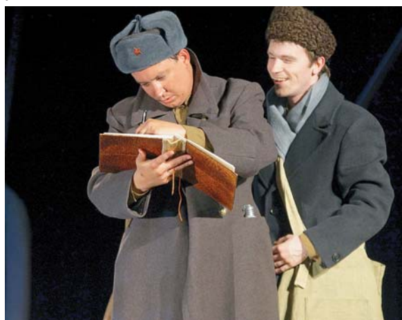
«Книга посетителей» и «Свеча» — трогательные истории, кажется, непридуманные эпизоды из общей истории о том, как советские солдаты освобождали Югославию.

Симонов был литератором, который сознательно стремился «написать войну правдиво и буднично, как великий и страшный труд». Писатель не приукрашивал события военных лет, но ярко и образно показывал их суровый лик. При этом он глубоко по-человечески осмысливал происходящее: в своих очерках, стихах и военной прозе показывал увиденное и пережитое им самим (а ему, военному корреспонденту, деятельному и наблюдательному, пришлось увидеть немало) и тысячами других участников войны.