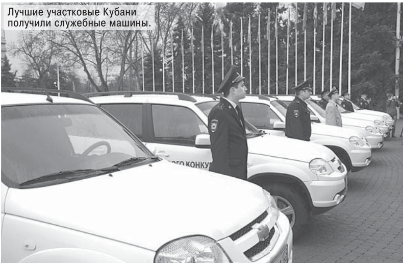
Лучшие участковые Кубани получили служебные машины.