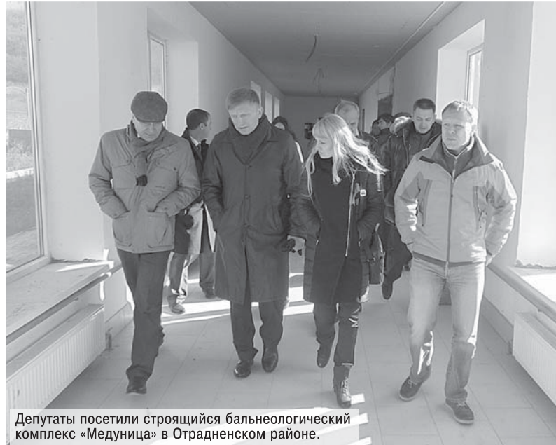
Депутаты посетили строящийся бальнеологический комплекс «Медуница» в Отрадненском районе.