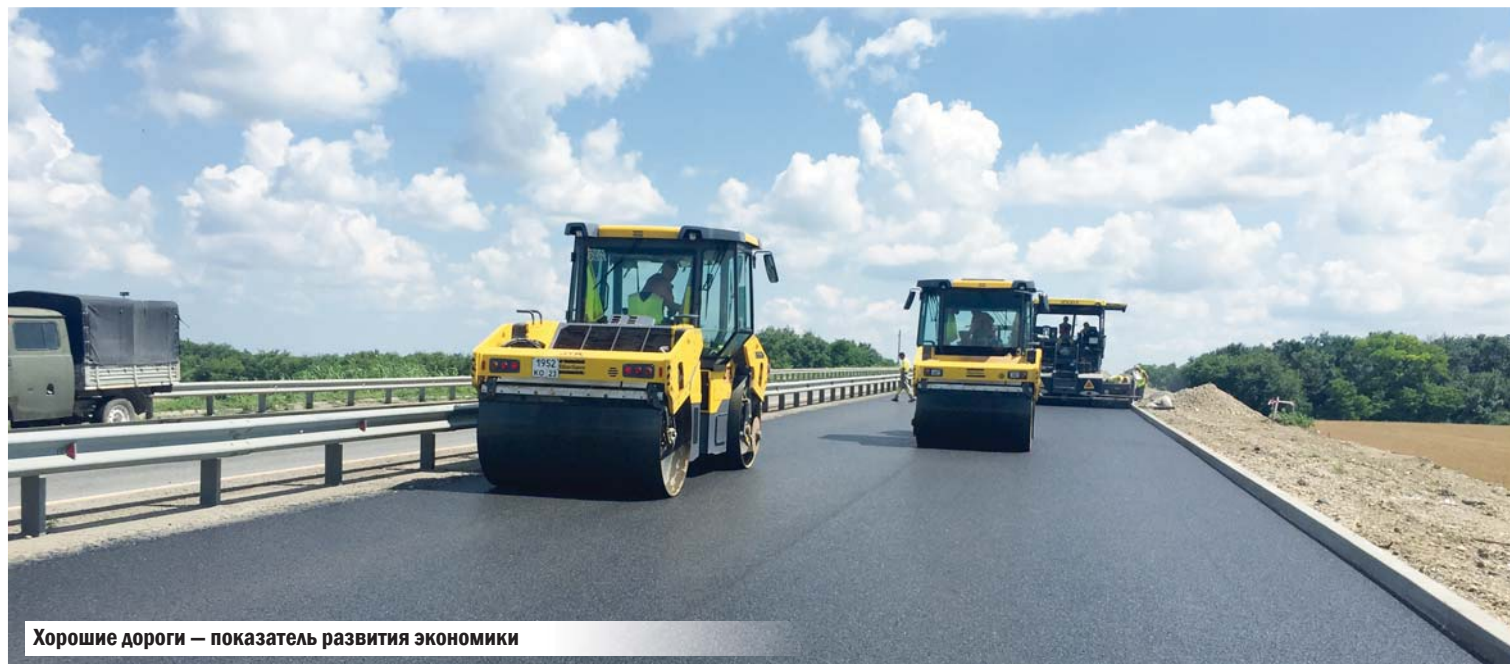
Хорошие дороги — показатель развития экономики

на просторной территории, — гаражи, навесы над техникой, офисные и хозяйственные помещения, даже сад с вечнозелеными туями и можжевельником — всё сделано по-хозяйски.