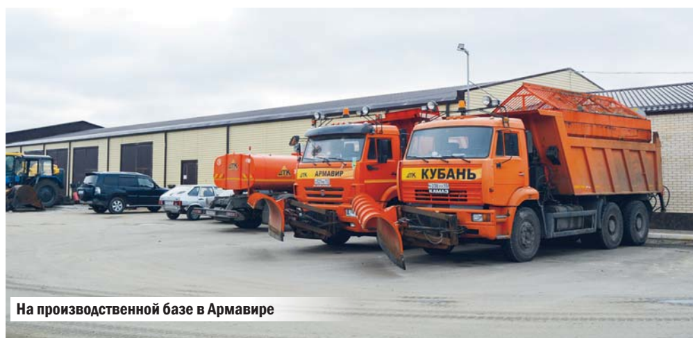
На производственной базе в Армавире