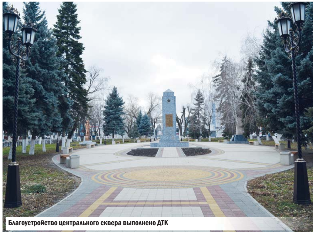
Благоустройство центрального сквера выполнено ДТК