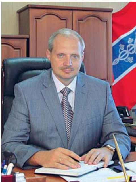
ВСЁ ДЛЯ ПРОМЫШЛЕННОГО РОСТА

На Международном форуме «Сочи-2014» Армавир представляет 23 инвестиционных проекта