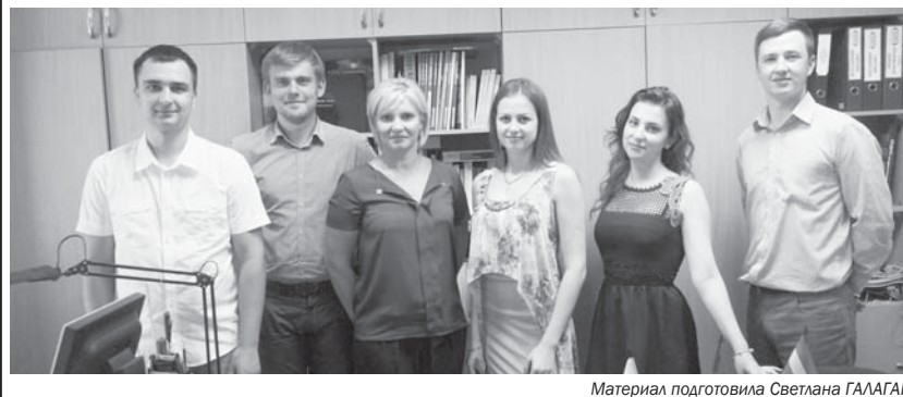
Материал подготовила Светлана ГАЛАГАН