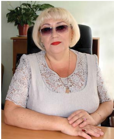
КУЛЬТУРНАЯ ЛЕТОПИСЬ РАЙОНА ПОПОЛНЯЕТСЯ

Так уж получилось, что все, кто служит госпоже Культуре, отмечают профессиональный праздник дважды в конце марта. За общим профессиональным праздником следует День работника культуры Краснодарского края. В эти праздничные дни все поющие и танцующие, молодые и старые, просто любящие послушать хорошую, душевную песню или посмотреть зажигательный танец, любители киносеансов или книгочеи, посетители музеев, а главное — все без исключения работники культуры: будь то самодеятельный коллектив, вокалист, чтец, танцор, работник библиотеки или музыкальной школы получают еще большее вдохновение. И не только от аплодисментов и оваций, но и от заслуженных наград: почетных званий, благодарственных писем, грамот, различных призов и денежных премий.