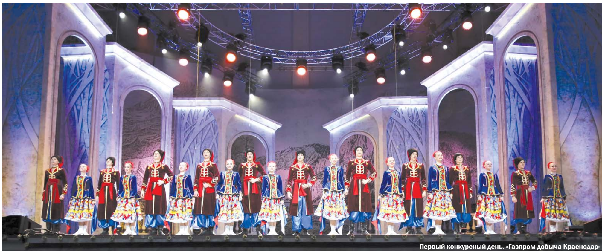
Первый конкурсный день. «Газпром добыча Краснодар»