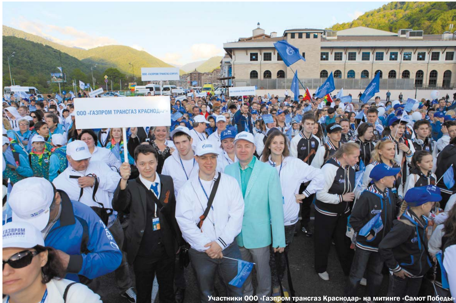
Участники ООО «Газпром трансгаз Краснодар» на митинге «Салют Победы»