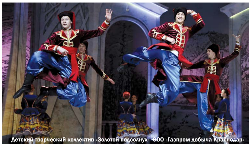
Детский творческий коллектив «Золотой подсолнух» ООО «Газпром добыча Краснодар»

Краснодарский край уже четыре раза принимал финал фестиваля. Заключительные туры с