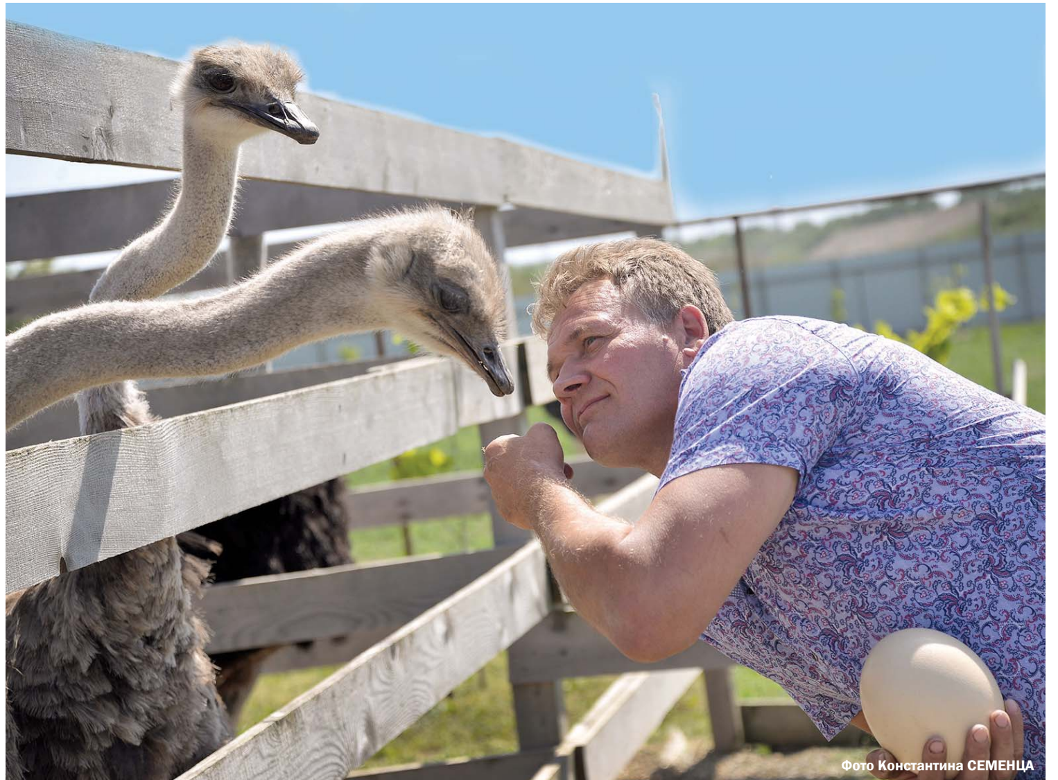
Фото Константина СЕМЕНЦА

Пресс-служба администрации Краснодарского края